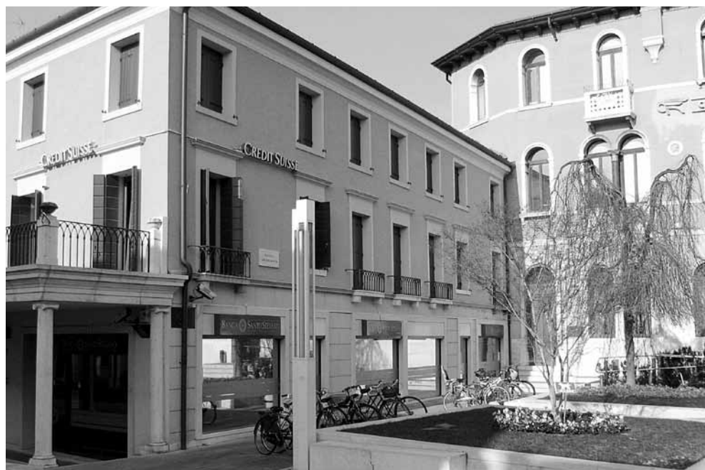
Fig. 3: l'attuale edificio che chiude a ovest Piazzetta Matter ospitò l'UPM nel 1922-'25 e fu poi sede della Casa del Soldato Italiano e per un breve periodo della Polizia di Stato.