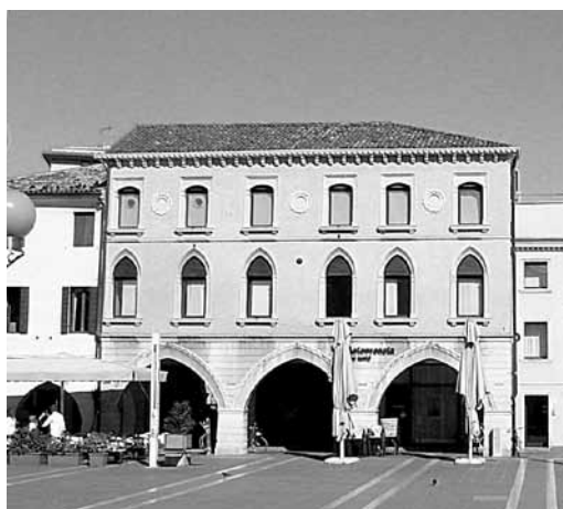
Fig. 20: immagine attuale del civico 28.