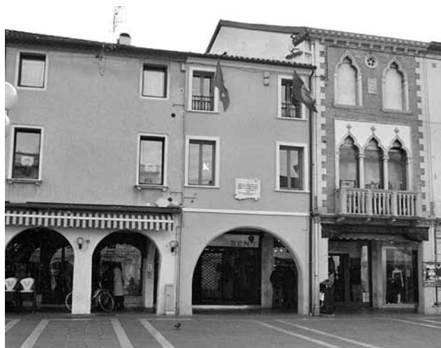
Fig. 21: Piazza Ferretto 13 vista dall'esterno con le finestre della sede UPM al primo piano.