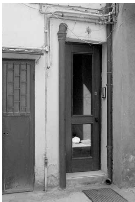
Fig. 27: la porta a destra corrisponde al civico 6 che conduce al secondo piano, allora sede dell'UPM.