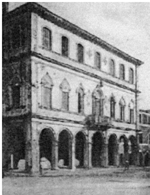
Fig. 12: il Municipio di Mestre, già sede dell'UPM nel 1921-'22 e poi dal 1945 al 1952, almeno.