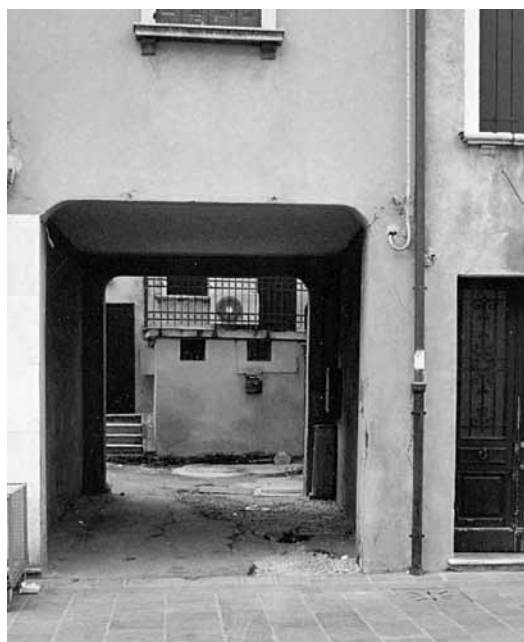
Fig. 26: il sottoportico di Via Pescheria Vecchia, che conduce al civico 6 e alla sede UPM dal 1962 al 1966.