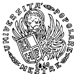
Fig. 6: il logo UPM in uso fino a poco tempo fa, recante la data "1860".

4. Sergio Barizza: Storia di Mestre, pagg 147 e segg; il Poligrafo ed. 2003