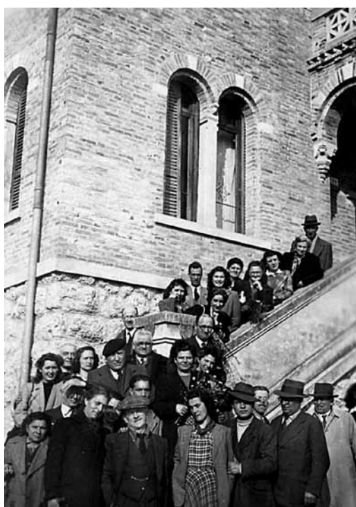
Fig. 15: l'UPM in gita ad Asolo, 1949.