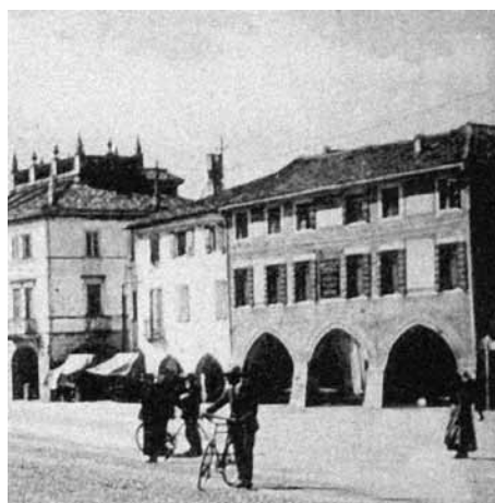
Fig. 19: Piazza Ferretto negli anni '40. Il primo arco a sinistra consente di accedere al civico 28, sede testimoniata dell'UPM. Da una vecchia cartolina.