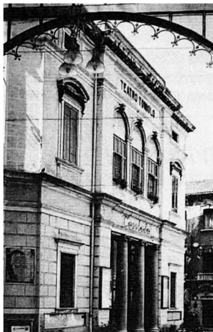
Fig. 13: il teatro Toniolo che ci ospitò dal novembre 1951 al maggio 1952.