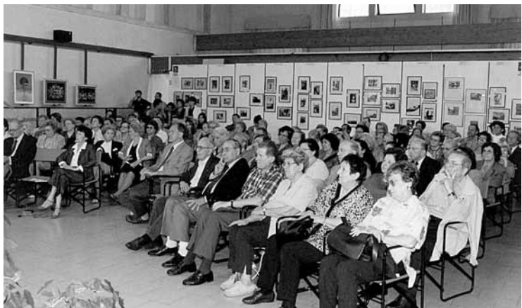
Fig. 36: chiusura dell'anno accademico 2002-'03 a S. Maria delle Grazie.