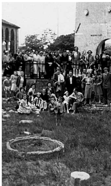
Fig. 14: l'UPM in gita a Torcello nel 1949.