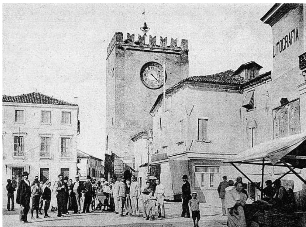
Fig. 2: Piazza delle Erbe, ora Matter, negli anni '20, da una vecchia cartolina.