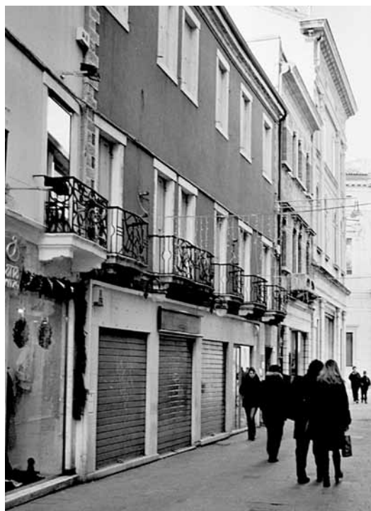
Fig. 28: via Battisti 7, che ospitò l'UPM al secondo piano dal 1966 al 1988.