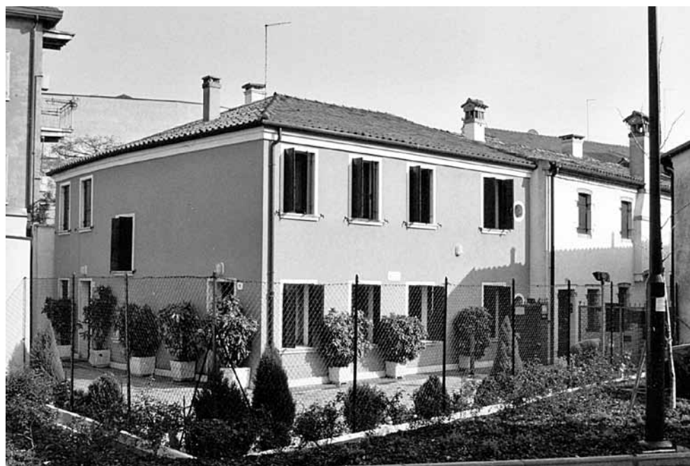
Fig. 34: Corte Bettini 11, attuale sede UPM dal 1988.