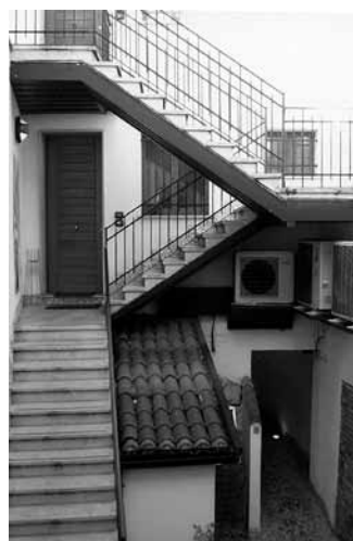
Fig. 2": piazza Ferretto 13, vista dalla scala interna. Al primo piano si accede al magazzino sede dell'UPM fino al 1962.